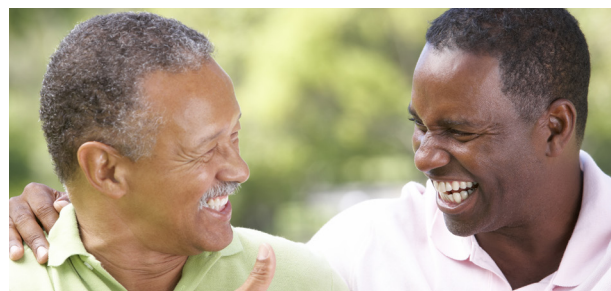
Los hombres de origen afroamericano representan la tasa más alta de pacientes con cáncer de próstata: hasta un 50 % más alta que el hombre estadounidense promedio.

Se están desarrollando nuevas pruebas, así que puede preguntar si hay otras pruebas disponibles al consultar a su proveedor de atención médica.